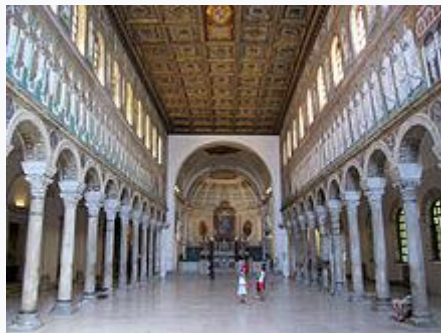
Тринефната базилика Сант Аполинаре Нуово в Равена (VI в.)