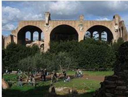
Развалините на базиликата на Максенций в Рим (началото на IV в.)