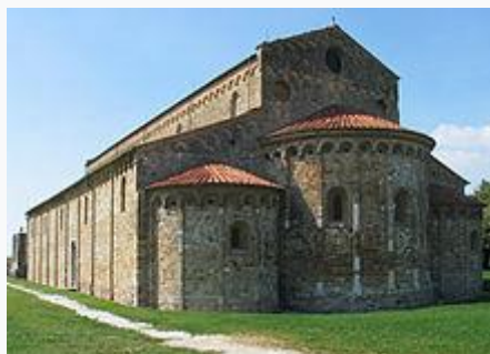
Романската базилика Сан Пиеро а Градо в Пиза (X век)