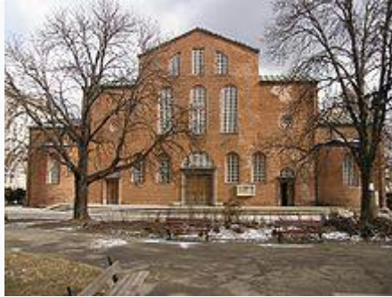
Базиликата „Света София“ в София

Базилика (на гръцки : βασιλική – „царски дом“) е вид сграда с правоъгълна форма, състояща се от нечетно число (1, 3 или 5) различни по височина нефове .