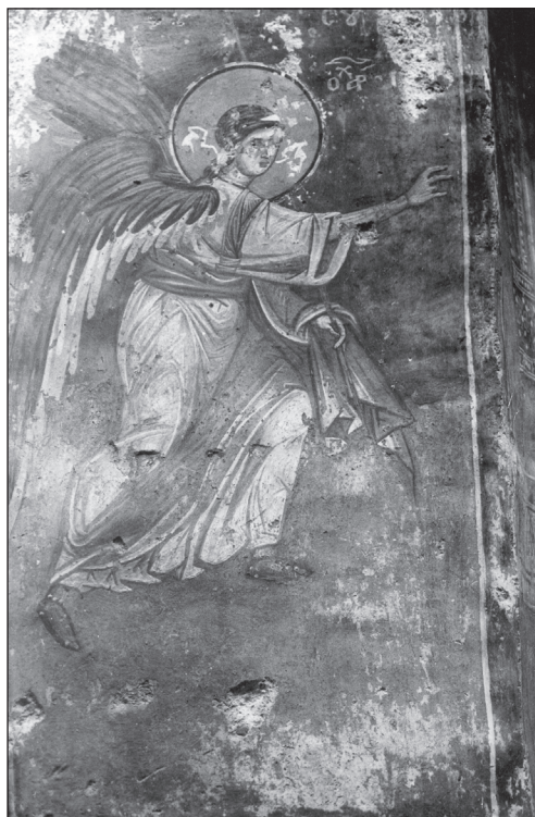
Архангел Гавриил от Благовещението в църквата „Св. Богородица“ в Долна Каменица (1323–1330)

Сцената е изписана на профилите на предапсидната арка във втория регистър на стенописите в църквата „Св. Богородица“ в с. Долна Каменица, Нишко (днес в Сърбия).