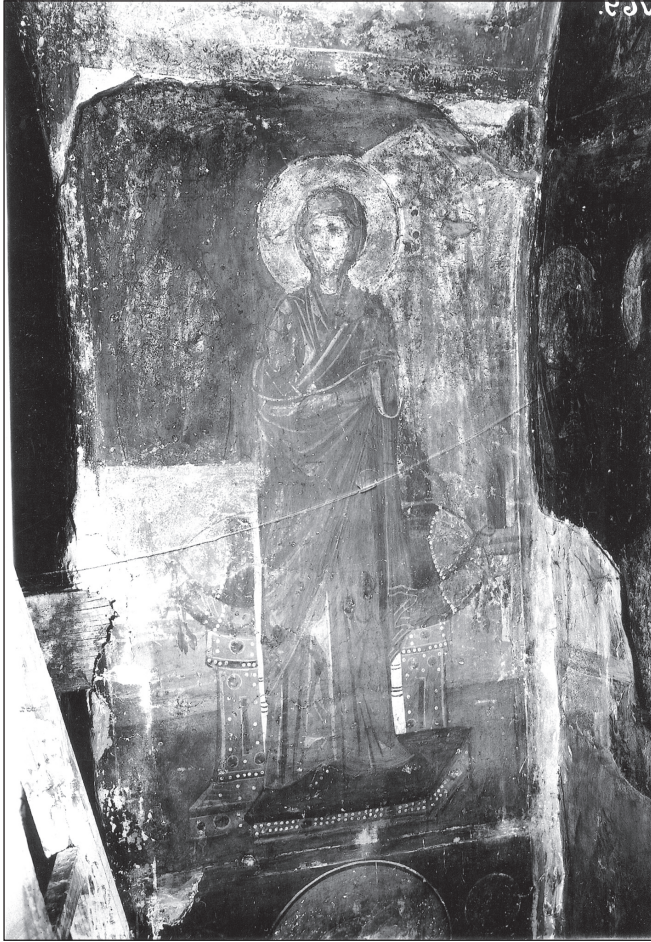
Богородица от Благовещението в Боянската църква (1259)

Изправена е пред трон без облегалка, украсен с бисери и скъпоценни камъни, на който се виждат две общити с бисери възглавници. Стъпила е на четвъртит нисък субпеданеум (под-