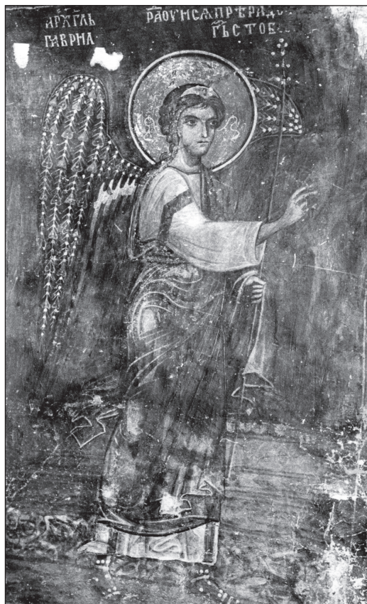
Архангел Гавриил от Благовещението в Боянската църква (1259)

архъгълъ гаврна и раоунъ сѧ прѣбрадо... гъ с тово... На съответната част от профила на южната арка образът на Богородица е в недобро състояние. В дясната част на фона се издига висока тясна къща с двускатен покрив и прозорец с кръгли средновековни стъкла. Богородица е права, насреща, в лявата ръка с гранче, докато дясната, увита до лакътя в мафория, е обърната с длан към зрителя 45 .