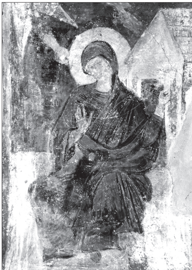
Богородица от Благовещението в Земенската църква „Св. Йоан Богослов“ (трето десетилетие на XIV в.)

напечното рамо на кръста, от двете страни на олтара, в редицата сцени от Големите църковни празници 48 . Архангелът, с жезъл в лявата ръка, е запътен с широка крачка. Дясната му ръка е протегната в трипръстна благословия (символ на единството на Троицата). Дрехите са доста изличени, но личат лорът, премет-