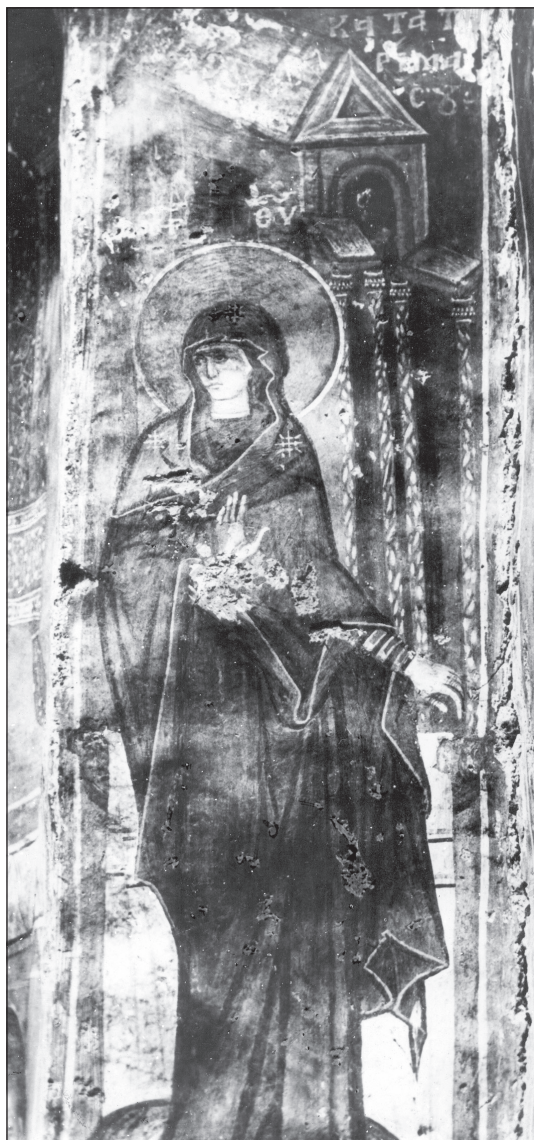
Богородица от Благовещението в църквата „Св. Богородица“ в Долна Каменица (1323–1330)

Те са датирани от изображението на Михаил деспот, син на цар Михаил Шишман в третото десетилетие на XIV век. Архангел Гавриил и тук е с едра крачка, жезъл в лявата ръка, дясната е