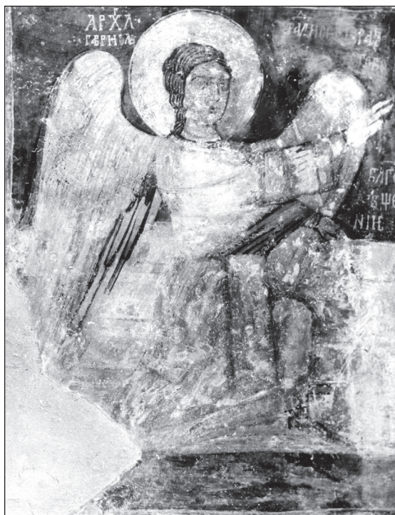
Архангел Гавриил от Благовещението в Земенската църква „Св. Йоан Богослов“ (трето десетилетие на XIV в.)

Във втория слой на Земенската църква „Св. Йоан Богослов“, от XIV в., Благовещението е в извивката на сводовете от